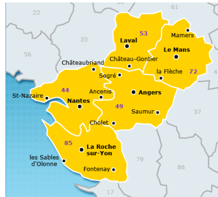
Pays de la Loire